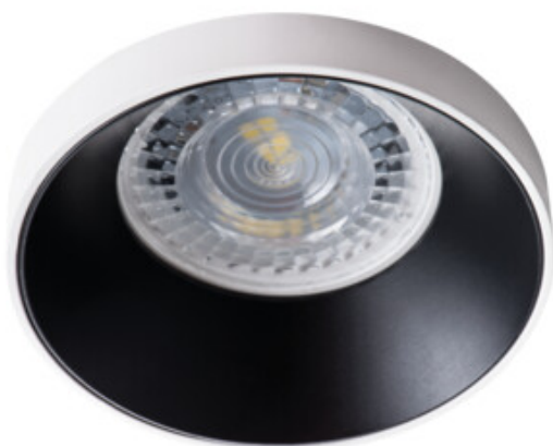
SIMEN DSO W/B