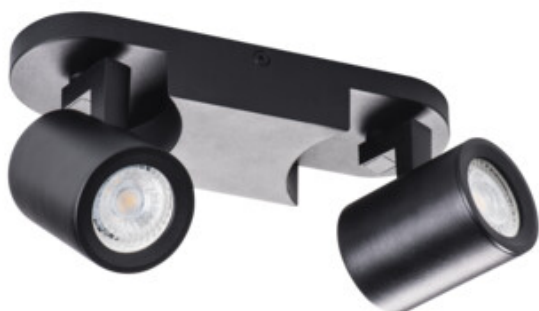
LAURIN EL-2I B