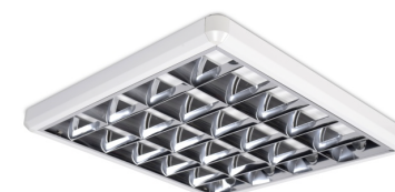
SAWA LED 4x60cm NT