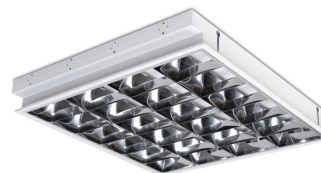
SAWA LED 4x60cm PT