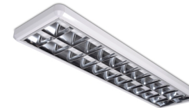
SAWA LED 2x120cm NT