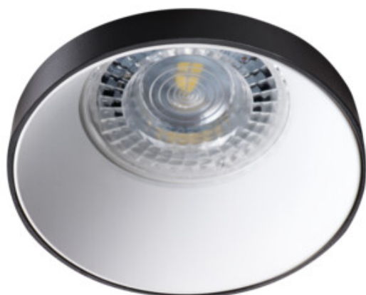
SIMEN DSO B/W