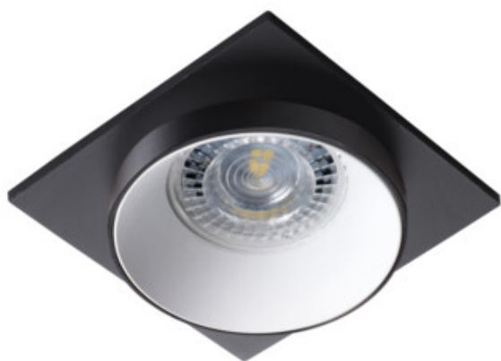
SIMEN DSL B/W/B