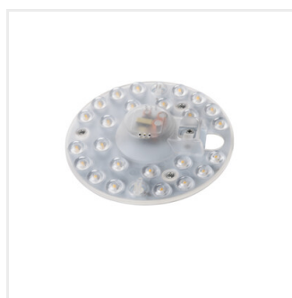
MODv2 LED 12W