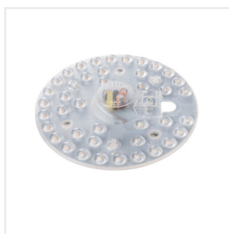
MODv2 LED 19W